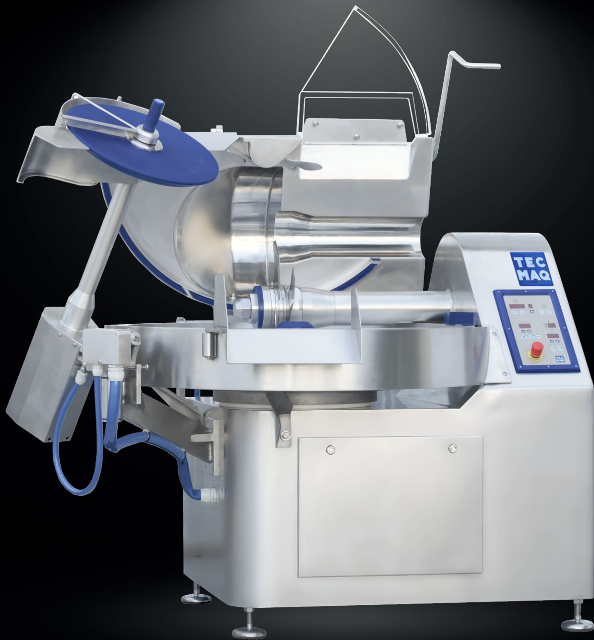
CUT MIX 120